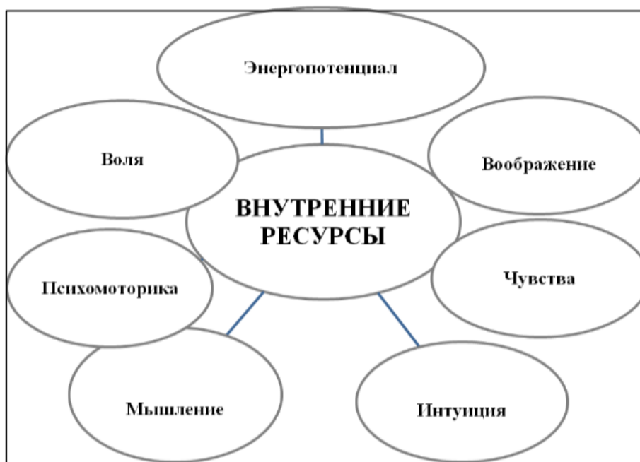
Рисунок 1. Структура внутренних ресурсов человека

Изобразите на отдельном листе бумаги каждый ресурсный компонент, можно в виде образа, предмета, явления и т.п. Подумайте, с какими жизненными трудностями этот ресурс вам помог справиться, обозначьте их на соответствующем данному ресурсу листе. На выполнение задания отводится 15 мин. Приступайте.