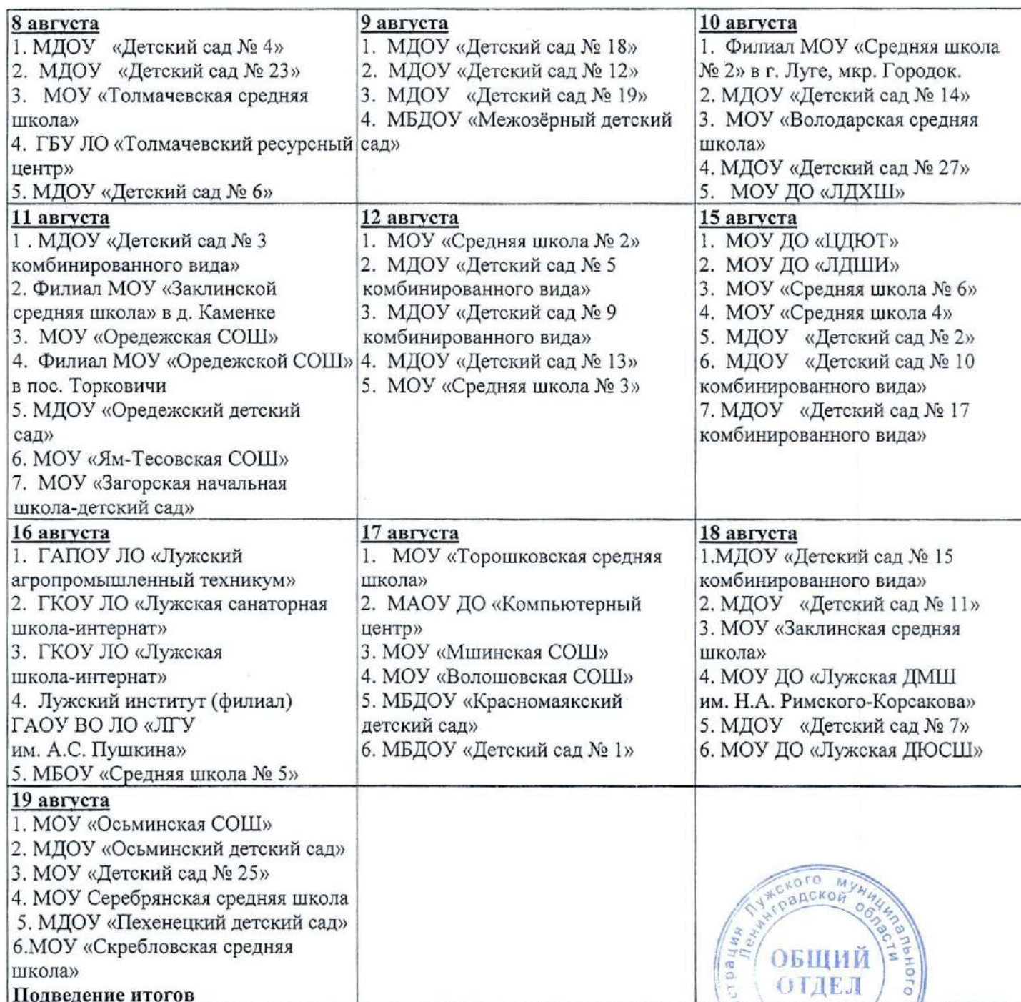
ГРАФИК приемки образовательных организаций Лужского муниципального района к новому 2022/2023 учебному году